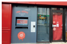
GANG OF PIZZA Libre-service de pizzas. 22 avenue Victor Hugo