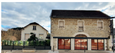
LE 1968 Bar-restaurant. 47 avenue Victor Hugo